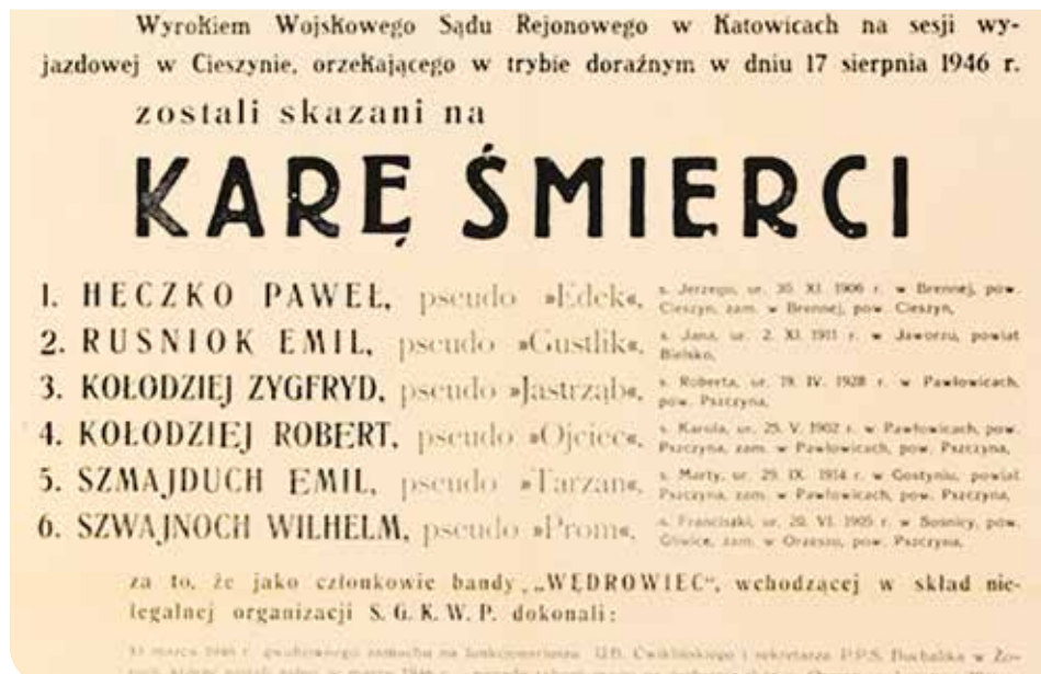
Fragment obwieszczenia Wojskowego Sądu Rejonowego w Katowicach o wydaniu wyroków śmierci na żołnierzy podziemia niepodległościowego w 1946 roku

sądy te funkcjonowały w Białymstoku, Chełmie, Katowicach, Lublinie, Przemyślu, Siedlcach, Rzeszowie i Warszawie 54 . Tym samym rozkazem powołano Sąd Wojskowy Polskich Kolei Państwowych w Warszawie 55 .